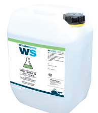
Art.-Nr. 062511 Kühlmittel für Schweißgeräte - 5 l