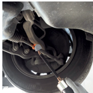
Entsperrung von Lenkgestängen