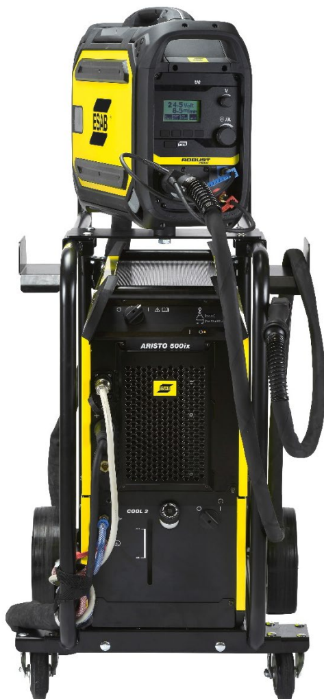
Aristo 500ix und Robust Feed U6

Die Aristo 500ix ist eine mobile, leistungsstarke Stromquelle für das Impulsschweißen mit einem robusten und zuverlässigen mechanischen Design. Zusammen mit der Robust Feed U6 oder Pulse erhalten Sie die perfekte Lösung für anspruchsvolle Impulsanwendungen.